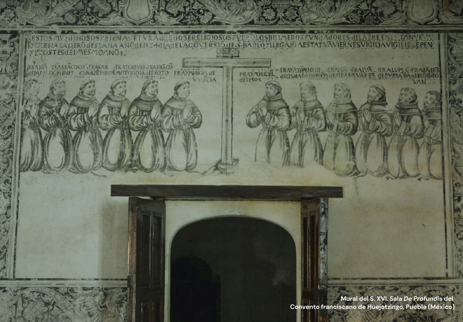
Mural del S. XVI. Sala De Profundis del Convento franciscano de Huejotzingo, Puebla (México)